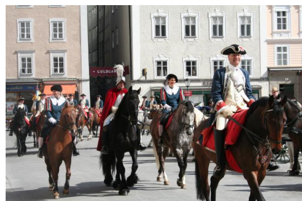
Foto: Georgiritt in Salzburg

Einer der bekanntesten Georgiritte findet in Traunstein statt. Hier wird auch der Schwertertanz aufgeführt. In historischen Landsknechtuniformen und mit blumengeschmückten Schwertern zeigen 16 Tänzer und ein Vortänzer diesen alten Tanz, mit dem symbolisch der Winter vertrieben wird.