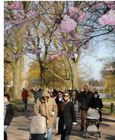
Foto: Osterspaziergang in Hamburg an der Alster

Ursprünglich nannte man den Osterspaziergang am Ostermontag „Emmausgang“. Er geht auf eine biblische Geschichte zurück: Jesus hatte nach seiner Auferstehung am Ostermontag zwei Jünger auf dem Weg nach Emmaus begleitet. Die Jünger erkannten ihn nicht. Erst als er das Brot mit ihnen teilte, erkannten sie ihn.